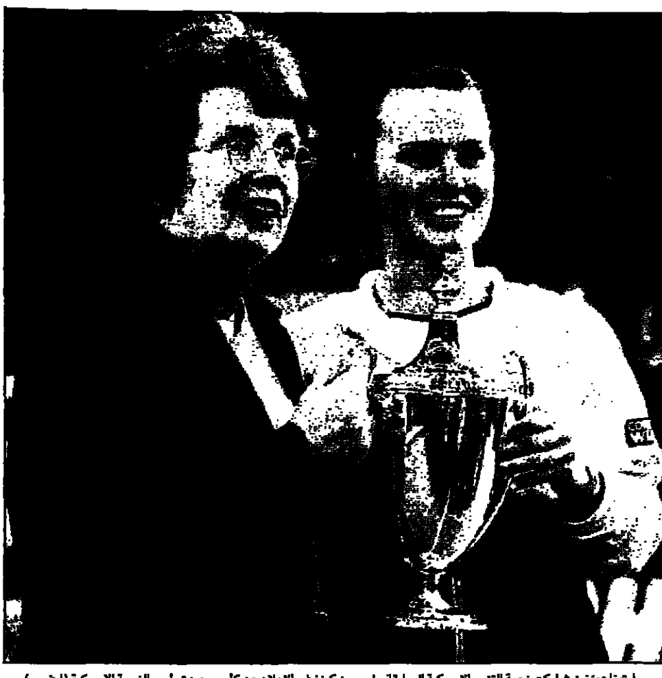
ملوكينا ميخائيل شاركت للتمسك الاسبوعية بيبي جون كينغ في اعلان من كأس جديدة باسم النجمة الامريكانيه (اليمين)